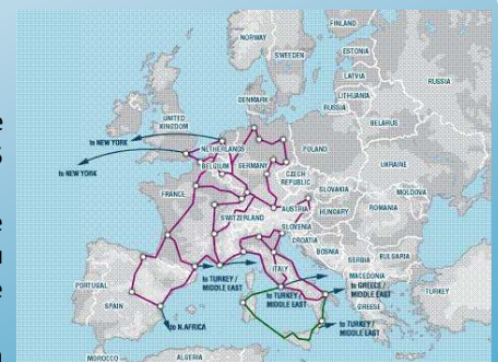
Le réseau Interoute à l'époque

Notre nom actuel, 21st Century communication France SAS, date de 1998, lorsque le groupe Interoute lança le fameux programme d'investissement pour plus de 1.5 Milliards d'euros pour la construction d'un réseau fibres en Europe occidentale. Ce réseau, démesuré à l'époque, a été intitulé par Interoute et Alcatel, principal maître d'œuvre, comme étant le réseau européen du 21 ème siècle, d'où le nom d'I21 ou encore la dénomination sociale en France de l'entité propriétaire du réseau en France qu'est 21st Century communication France SAS. Avec l'intégration des entités PSInet et Via Networks rachetées en 2005 et l'utilisation du nom Interoute comme marque commerciale, nous avons souhaité changer notre dénomination commerciale en Interoute France SAS, prenant effet le 01/01/2010.